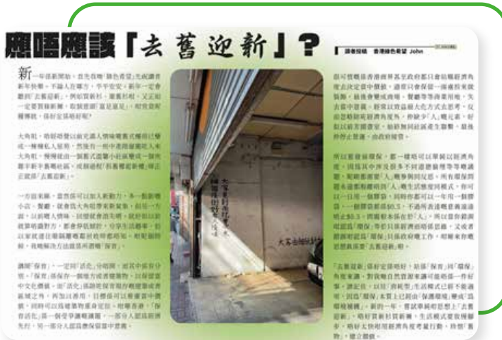
2022.2 大角咀社區報《角醒》